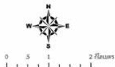
รูปที่ 1-3 แสดงโครงข่ายคมนาคมเข้าสู่พื้นที่โครงการ