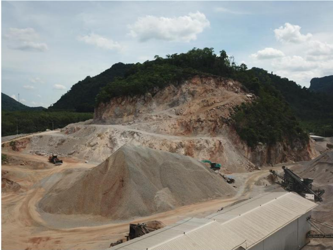
① หน้าเหมืองปัจจุบันเมื่อมองไปทางทิศตะวันตก