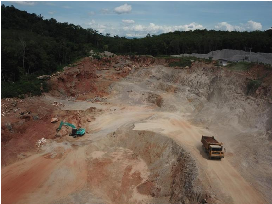
② สภาพพื้นที่โครงการปัจจุบันเมื่อมองไปทางทิศตะวันออกเฉียงใต้